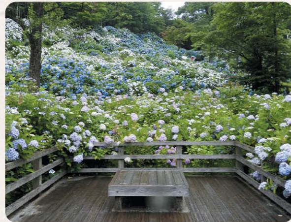
アジサイ園デッキ