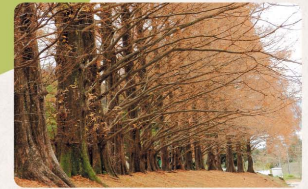
メタセコイア並木