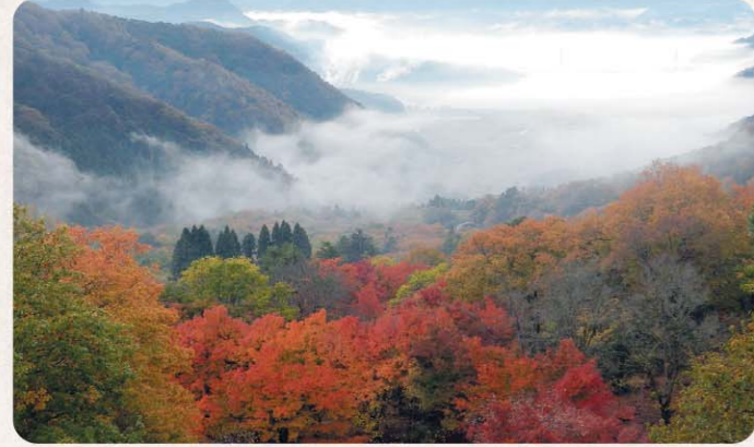
展望デッキから見る雲海